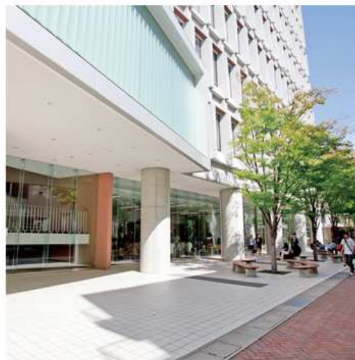
大阪電気通信大学 寝屋川キャンパス

本講演では、双方向型修学情報統合データベースを用いた教職員と学生によるPDCAサイクルの実践例について紹介します。